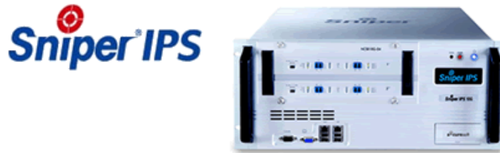
写真「SecureSoft Sniper IPS 10G」

キヤノンMJ ITグループのキヤノンITソリューションズ株式会社(本社:東京都港区、代表取締役社長:浅田和則、以下キヤノンITS)は、クラウドコンピューティング時代における大容量ネットワーク向け、不正侵入検知・防御システム「SecureSoft Sniper IPS 10G」を2月25日(金)より取扱い開始します。