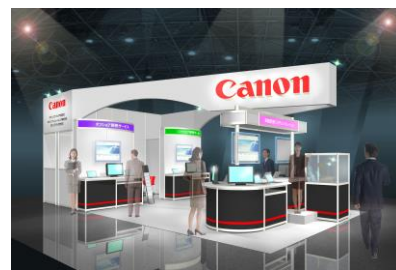
組込みシステム開発技術展

キヤノンITSは「ソフトウェア&アプリ開発展」「情報セキュリティEXPO」「組込みシステム開発技術展」の各展示会に出展し、「真に頼れるITパートナーへ」をテーマに顧客の多種多様なニーズに応える当社グループならではのサービス、ソリューション、製品を紹介します。「ソフトウェア&アプリ開発展」では開発現場を効率化するソリューションを、「情報セキュリティEXPO」ではキヤノンITSが取り扱うネットワークの入り口から出口までのさまざまなセキュリティ製品やソリューションを、「組込みシステム開発技術展」ではキヤノンの製品開発で培った各種サービスを、それぞれ紹介します。