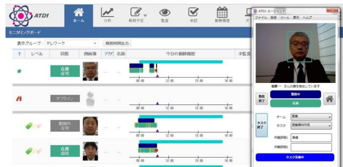
“テレワークサポーター”システム画面

社員のワークライフバランス向上や、育児・介護と仕事の両立サポートなど、多様な社会課題解決や働き方改革を推進するテレワークが昨今注目されています。政府もテレワークの普及目標を設定しており、2020年にテレワーク導入企業を2012年度比で3倍、週1日以上在宅勤務するテレワーカー数を全労働者の10%以上とすることを掲げています。テレワークを推進する企業は増加傾向にありますが、社員の勤務実態把握の煩雑さ、情報漏洩の懸念など課題をあげています。