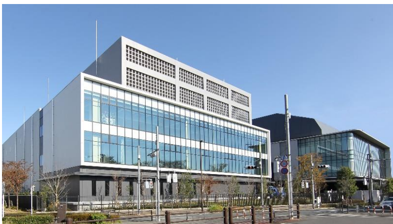
西東京データセンター

自然災害の影響を受けにくい武蔵野台地に立地した西東京データセンターは「ティア 4 レベルの高性能ファシリティ」、「世界基準の運営品質を証明するM & O 認証取得」、「充実した SE サービス」が評価され、金融業、製造業、クラウド事業者など数多くの企業に利用いただいています。