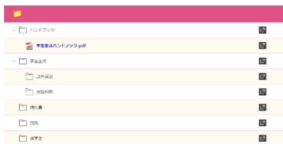
キャビネット機能（学生閲覧画面）

ホーム画面上にある検索窓からキーワード検索をすることで、ポータル内の「お知らせ」や今回、オプションとして機能追加された「キャビネット」など複数のコンテンツの中から既にトップ画面では表示されなくなった情報を容易に探すことができます。