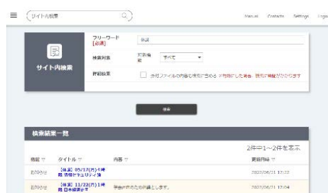
サイト内検索機能（詳細検索画面）