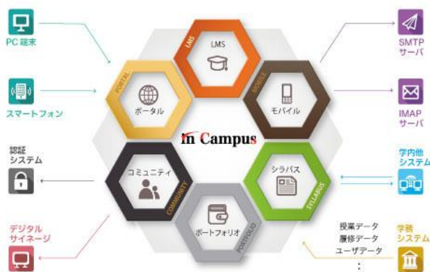
in Campus シリーズ 構成概念図

2021 年 4 月には従来のシステム導入型にクラウドサービス型も追加され利便性を拡充しています。