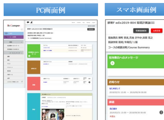
「in Campus ポータル」画面