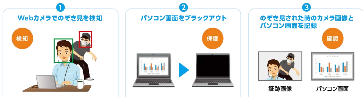
「のぞき見プロテクター」使用イメージ

プライバシーフィルターでは防ぐことが難しい背後からの「のぞき見」を防止します。プライバシーフィルターと併用することで、ほとんどの角度から「のぞき見」を防ぐことが可能です。