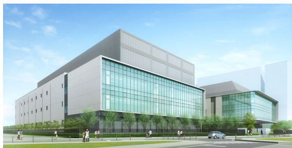
西東京データセンター