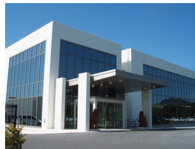
沖縄データセンター