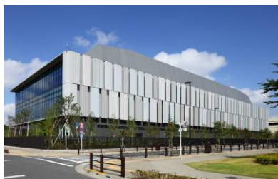
＜西東京データセンター＞

西東京データセンターは、2012年のサービス開始以来の、継続的な運営品質の向上活動の結果グローバル基準に合う優れた運営品質を実現できていることが認められ、国内で2社目となる「Management and Operations (以下M&O)」認証のほか、ISO/IEC 20000、ISO 22301を取得しております。西東京データセンターは、ティア4相当の最高ランクのファシリティと、グローバル基準を満たす高品質な運営体制をもとに、お客さまのシステムの安定稼働を実現する優れた信頼性を提供します。