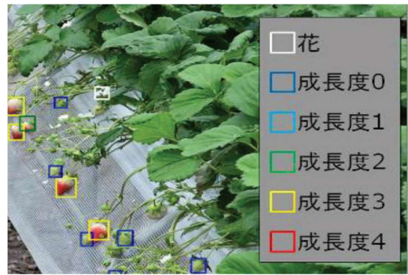
図4 画像から花・成熟度毎の果実を自動判別

※AI（人工知能）プラットフォーム「LaiGHT（ライト）」は、キヤノン IT ソリューションズ株式会社の登録商標です。LaiGHT は、LIGHT（明かり）+AI＝「AI で世界を明るくするためのシステム」という意味があります。