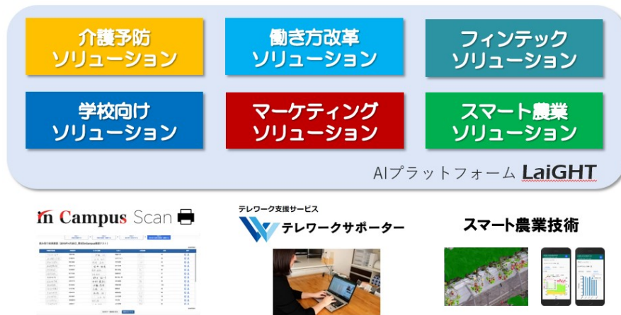
図1 AIプラットフォーム「LaiGHT」を活用したソリューション