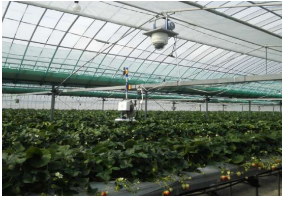
図3 イチゴハウス内に取付けられたカメラ