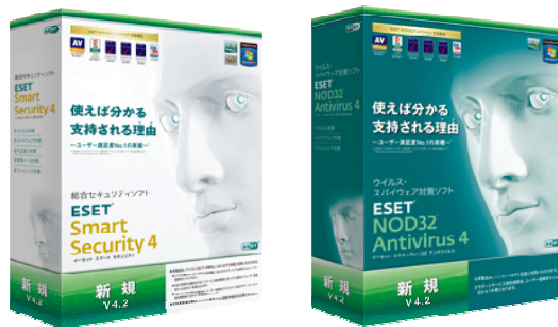
「ESET Smart Security V4.2」 「ESET NOD32アンチウイルス V4.2」 -ESET セキュリティソフトウェアシリーズ-